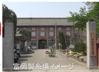
富岡製糸場イメージ