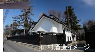
田村酒造イメージ