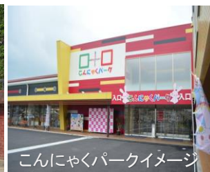
こんにやくパークイメージ