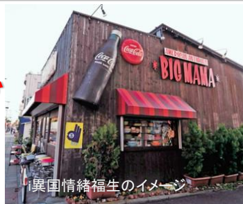
異国情緒福生のイメージ